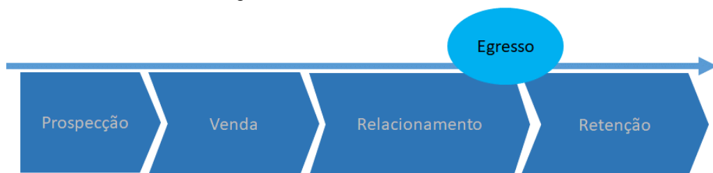
Figura 1: Ciclo de vida do acadêmico

ticas de integração da instituição com os públicos que afetam a completa formação e satisfação de seus acadêmicos.