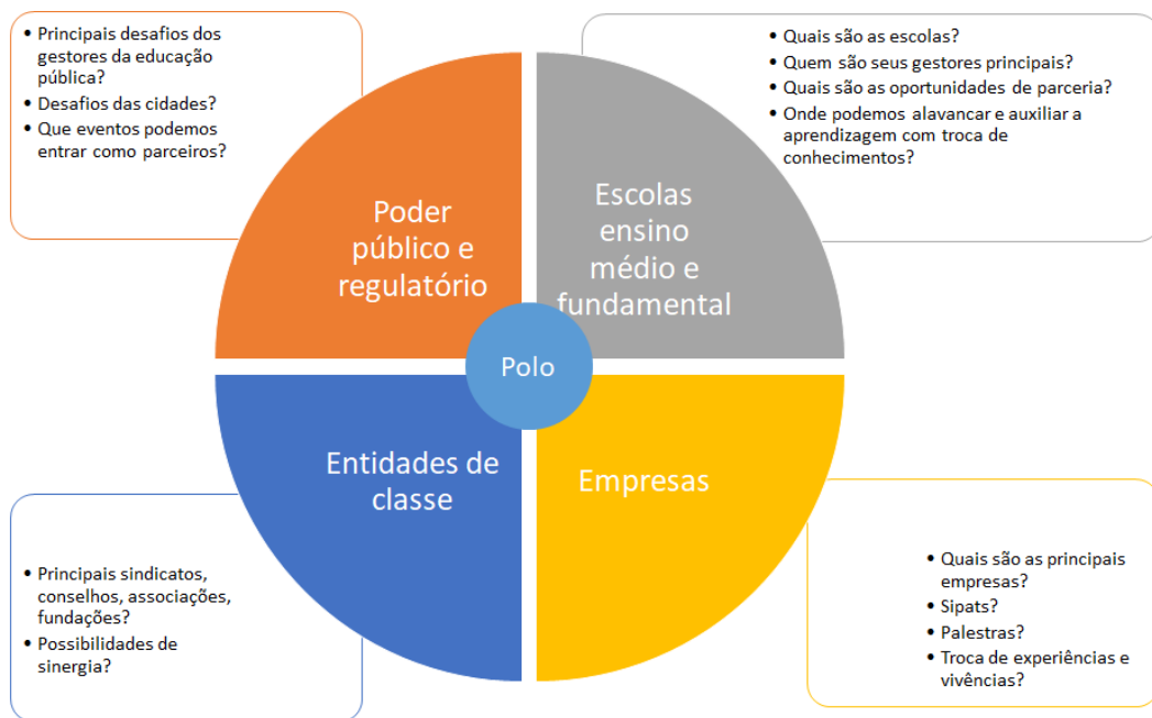
Figura 2: Mapa de relacionamento com o entorno

b) Mapa de relacionamento com o mercado local: Partindo das descobertas nas pesquisas, desenvolvemos o modelo de comunicação da Uniassselvi com seu entorno, que determina o conjunto de ações de comunicação e interação com a sociedade em geral. Para nos nortear nas decisões e políticas do modelo de comunicação, construímos uma ferramenta – o Mapa de Relacionamento com o Entorno (Figura 2), que visa identificar os principais públicos que devem ser atendidos e priorizados por cada uma de nossas unidades em suas ações de comunicação.